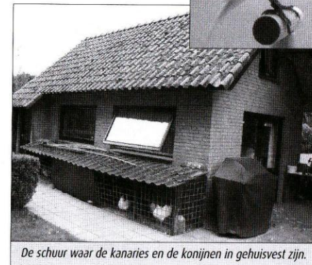
De schuur waar de kanaries en de konijnen in gehuisvest zijn.